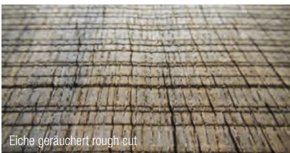
Eiche geräuchert rough cut