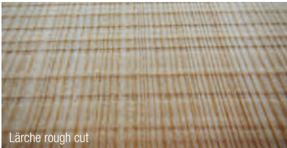
Lärche rough cut