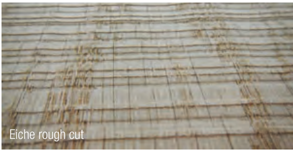
Eiche rough cut

Weitere Holzarten sowie Sonderstärken können wir auf Anfrage ebenfalls anbieten / produzieren. Wir bieten auch bereits fertig furnierte Platten mit Sägerau Holzarten an. Diese werden immer individuell auf Ihre Wünsche hin gefertigt.