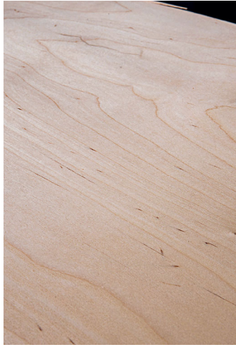
Föhre (l.) als einzelne Furnierblätter und Birke (r.) als Fixmass.