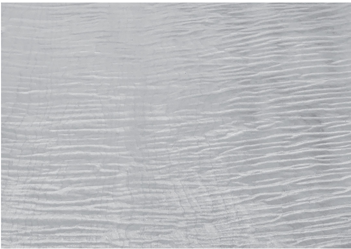
Besondere und dekorative Schäl furniere gehören zur Königsdisziplin beim Furnieren.